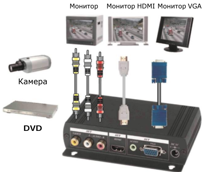
Схема подключения и установки: